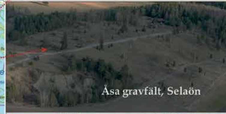
Åsa gravfält, Selaön