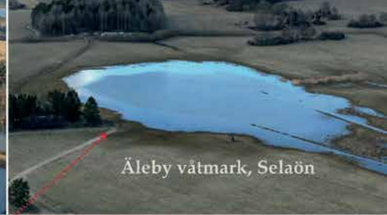
Äleby våtmark, Selaön