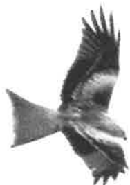
Röd glada

Även enstaka observationer av röd glada har gjorts i kommunen under årens lopp, bland annat 1 ex Näsbyholm, Vansö 31 mars 1940, 2 ex sågs vid Kolsundet 1941 (1 ex 25 juli på Selaösidan samt 1 ex 15 juni Toresundsiden), 1 ex Djupvik, Gripsholmsviken 18 maj 1941, 1 ex Mälsåker, Ytterselaö 14 juni 1943, flera ex Obygdön, Prästfjärden 29 juli 1943, 1 ex Toresunds huvud, Prästfjärden 29 mars 1944.