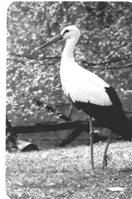
Vit stork.

Dagar med asterisk framför avser arrangemang i SOK:s regi.