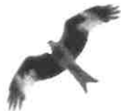
Röd glada

Förutsättningarna för att vi skall få tillbaka gladan till kommunen finns. Vi har de perfekta naturtyperna med