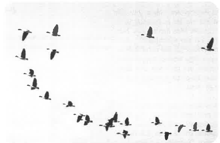
Sträckande grågäss.

Någon vecka senare var jag på en bussresa i Skottland. Det var ingen fågelresa, men det bryr sig ju inte fåglarna om. Jag kan nämna några minnesvärda