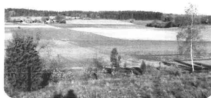
Vy från Åsa gravfält