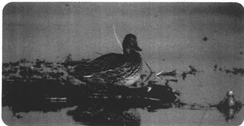
Krickhona Valnaren

Anmäl er till: Kent Söderberg Fridhemsgatan 27 645 40 Strängnäs Tel: 0152-17 007