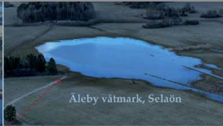
Äleby våtmark, Selaön