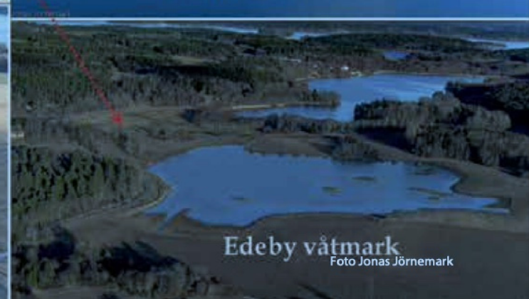
Edeby våtmark