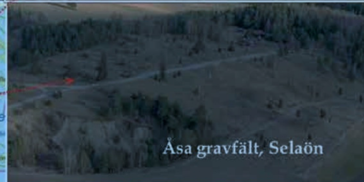
Åsa gravfält, Selaön