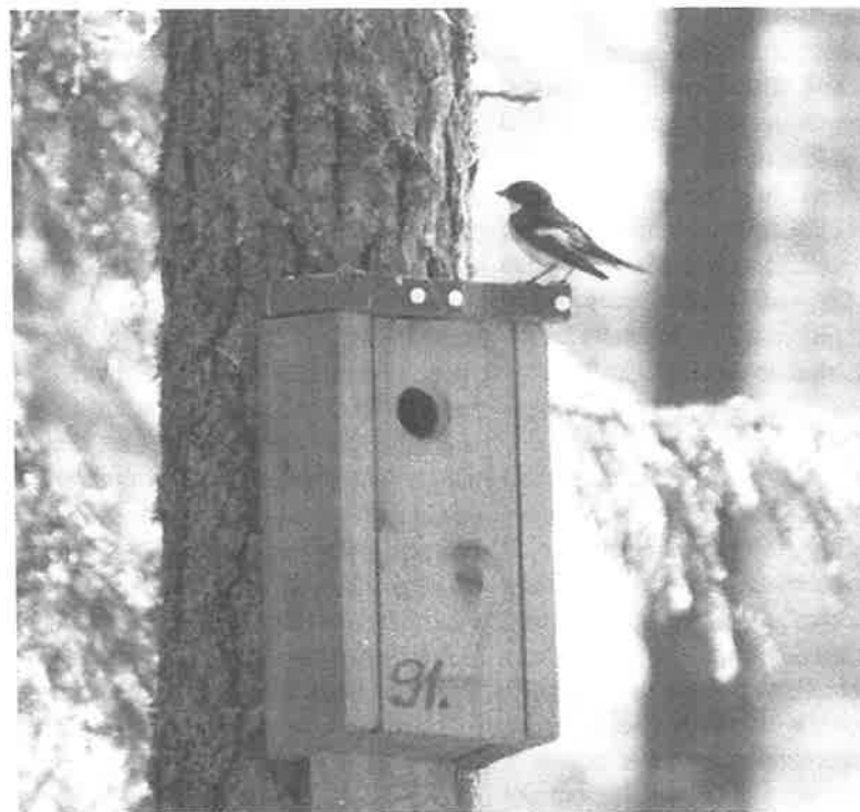
Svartvit flugsnappare

Någon kanske tycker att det verkar enahanda att bara hålla på med holkfåglar, mest mesar och svartvita flugsnappare men jag kan försäkra att så är inte fallet. I och med ringmärkningen så kommer ytterligare en dimension in av fågelskådandet. Varje fågel som jag sätter en ring på blir en specifik individ för mig.