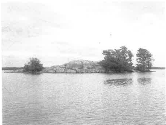
Lilla Skinnpälsten, Tynnelsöfjärden

Mälarens vatten blev väl inventerade eftersom flera ornitologer ställde upp med både båtar och tid. Det medförde att alla de större fjärdarna, Prästfjärden, Granfjärden, Norrfjärden, Gisselfjärden, Segeröfjärden, Marifredsviken m.m. besöktes vid ett flertal tillfällen under häckningsperioden.