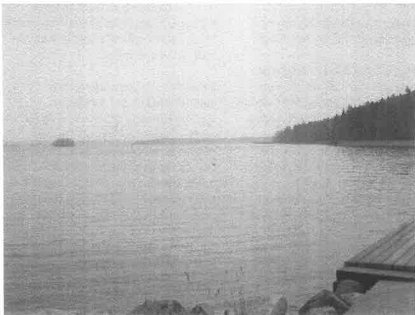
Hässelbyholms brygga, vy mot Norrfjärden