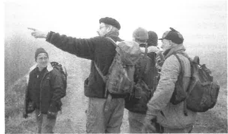
Inventering utanför Plavinas

Ovan hustaken i Strängnäs kan även den observante då och då få syn på en magnifik profil, nämligen havsörnen. En fantastisk upplevelse om man betänker att