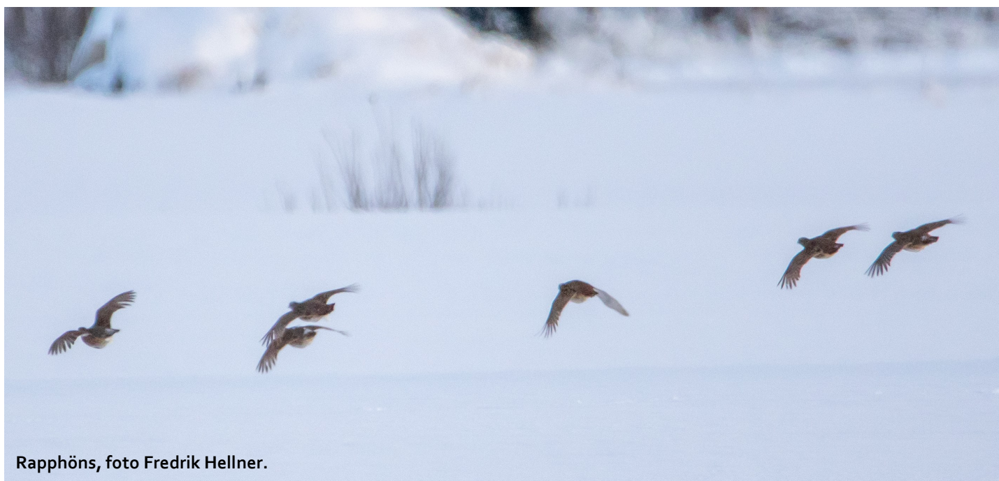
Rapphöns, foto Fredrik Hellner.

Årsrapport 2023 för en flygande start på årets skådning.