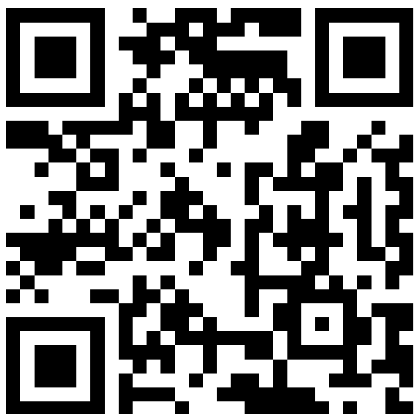
Trastsångare, ljudupptagning Petter Kappel

Första: 1 ex. spel/sång Råcksta björkskog, Åkers styckebruk 29/4 (UJ), 1 ex. spel/sång Skogsgenvä-