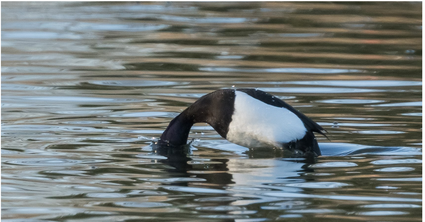
Vagg, hane

från 2020, Jättne viltvatten, Överselö. Arten är långt ifrån ovanlig i vårt rapportområde, men ovanligt med häckning i Södermanlands län. Antal rapporter 20 (18).