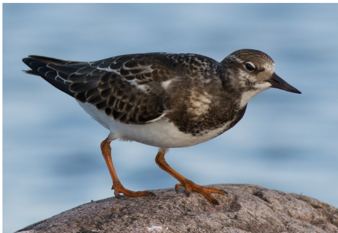
Roskarl, Sandbyborg, Öland, betydligt vanligare där än här, foto Ulf Gustafsson

Första vår; 1 ex. rastande, Näsbyholmsundet, Sör-