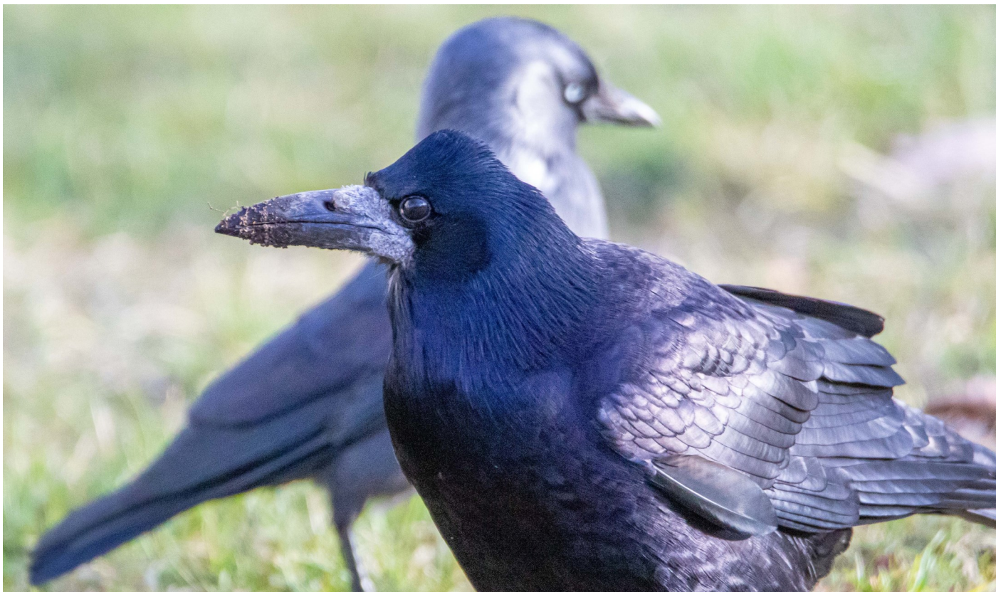
Råka och kaja

Första: 1 ex. förbiflygande Kolsättersvägen 7/5 (BA). Sista: 1 ex. födosökande Valnaren 7/9 (BA). Antal rapporter 66 (58).